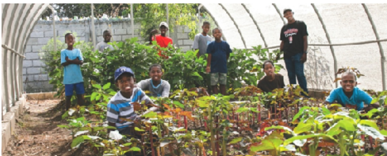
Sustainability | Agricultural Training Center in Haiti | Love A Child

Celem Harvest Craft jest walka z głodem i ubóstwem nie poprzez "rozdawnictwo" lub programy uprawnień, ale poprzez wyposażanie rodzin w umiejętności, edukowanie ich z głęboką wiedzą kontekstualną, a ostatecznie wzmocnienie ich zdolności do zapewnienia utrzymania siebie i swojej społeczności, nie będąc już zależnymi od pomocy z zagranicy. Harvest Craft ma nadzieję, że uczestnicy staną się agentami transformacji nie tylko w swoich własnych społecznościach, ale będą służyć jako zasoby dla innych krajów rozwijających się, które również znajdują się w wielkiej potrzebie.