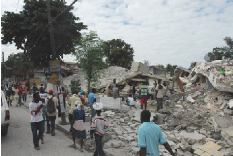
Haiti: hunger sparks growing protests - World Socialist Web Site (wsws.org)